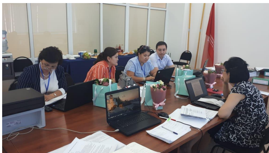
Фото 4. РҚМИ құжаттамасын зерделеу