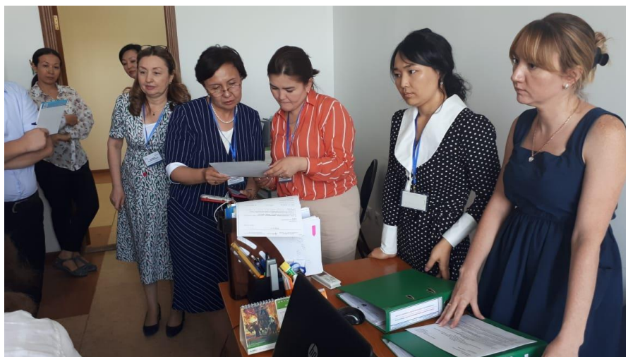
Фото 3. РҚМИ құжаттамасын зерделеу

бақылау-өлшеу құралдары, әдістемелік консультативтік-кеңесші орган туралы ереже) зерделеді, отырыс хаттамалары, ТОО, ОӘК, 2018 және 2019 жылдарға арналған күнтізбелік-тақырыптық жоспар, тыңдаушылармен және жұмыс берушілермен кері байланыс сауалнамалары, сауалнама нәтижелері бойынша есептер және қабылданған шаралар, әдеп кодексі және т.б.), соның ішінде ССК мүшелерінің сұрауы бойынша құжаттама зерделенді (фото 3,4,5). Аккредиттеу стандарттарын орындау және өзін-өзі бағалау туралы есептің деректерін тексеру үшін сыртқы сарапшылар өзін-өзі бағалау жөніндегі нұсқаулықтың ұсыныстарына сәйкес 42 құжатты сұрады.