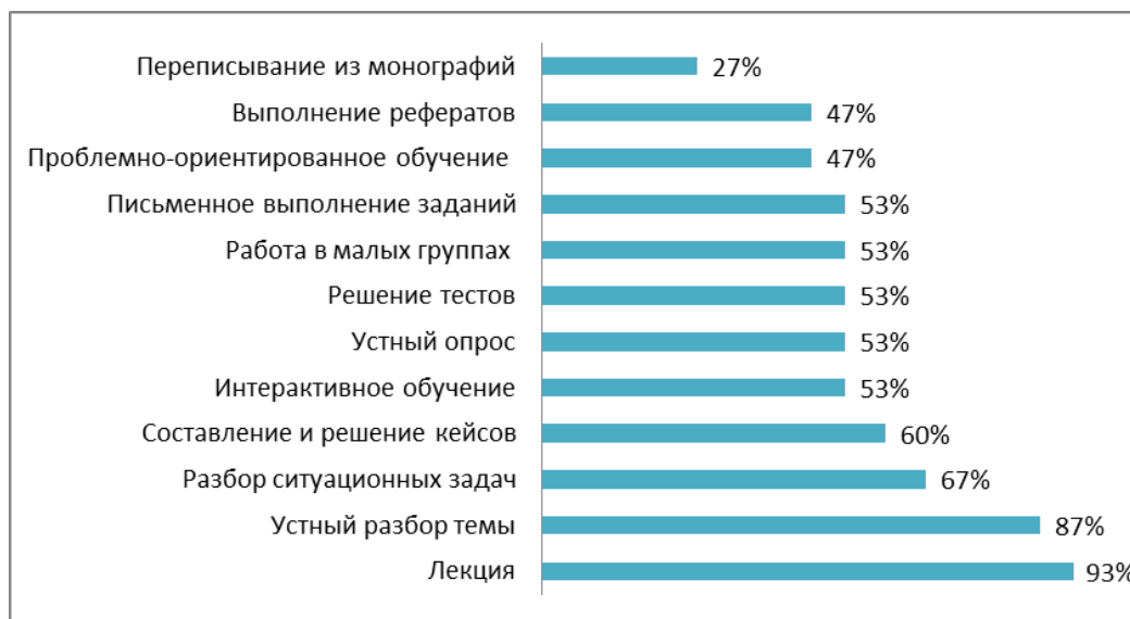
Сурет 1. РҚМИ оқытушыларының тыңдаушыларды оқытудың қолданылатын методдарына қатысты сауалнамасының нәтижелері.

Сабақ өткізу кезінде оқытушылар үшін ең алдымен бақылау-өлшеу құралдарының (67%), силлабустардың және ПОӘК (60%) болуы өте маңызды, 2-сурет.