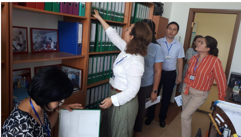
Фото 5. РҚМИ құжаттамасын зерделеу

Қорытындылай келе, сарапшылар жұмыстың бірінші күнінің қорытындыларын талқылады, өз әсерлерімен бөлісті, аккредиттеудің бірқатар стандарттарына сәйкестігі бойынша пікір алмасты, «РҚМИ» ЖШС сапарының екінші күнінің іс-шараларын жоспарлады.